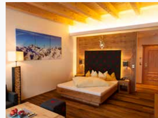
Die Ortstaxe wird separat berechnet. Pro Person und Nacht Euro 2,50,- ( Kinder ab 15 Jahre )